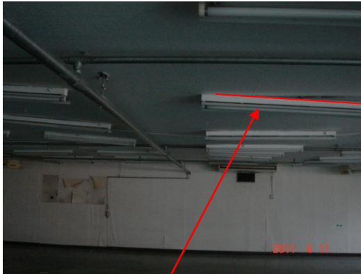
天井の湾曲(うねっている)