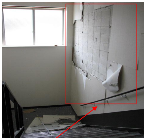
階段の脇の壁崩落