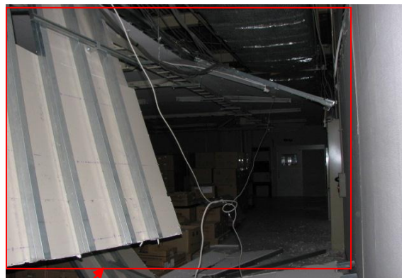
製造の通路の天井落下