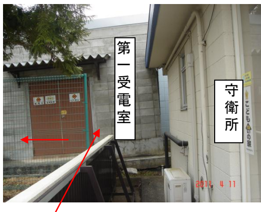
第一受電室が傾いている