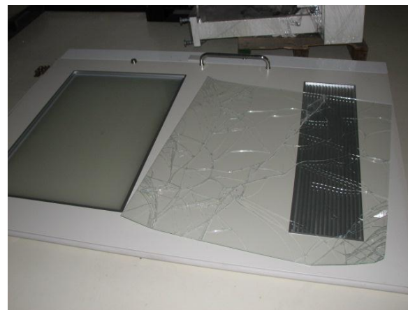
パーティションの倒れ、(多数)