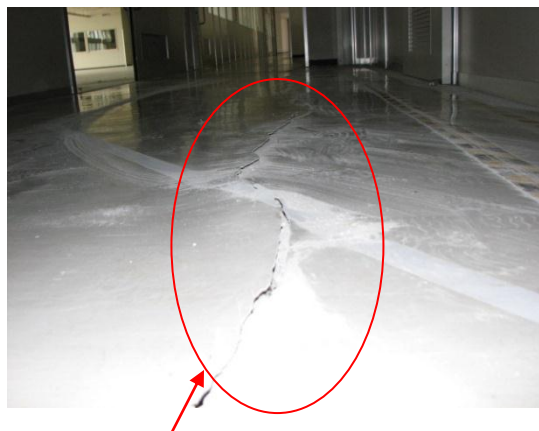
構内の地割れ(多数)