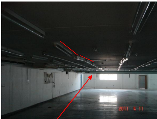
天井の湾曲(うねっている)