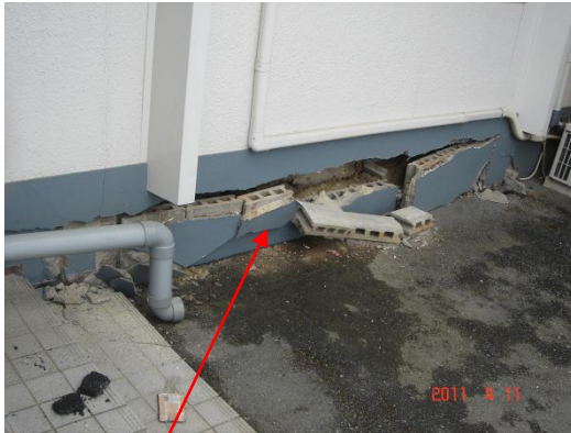
玄関脇の基礎の割れ