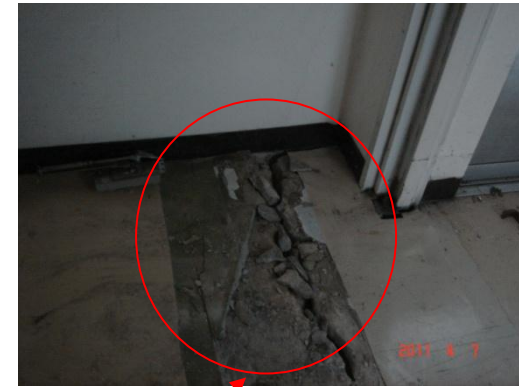
倉庫棟との段差(拡大)