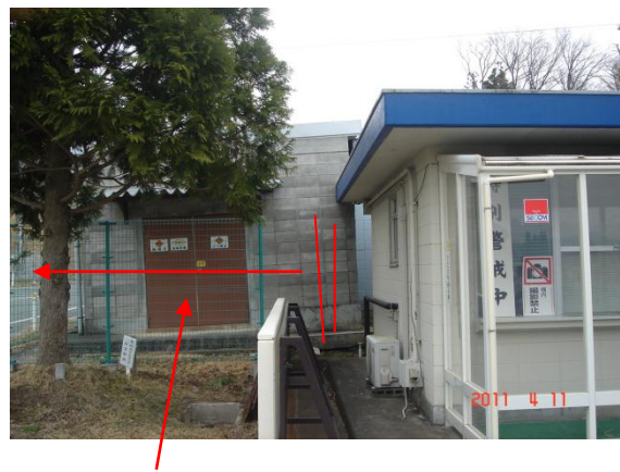
左側に傾いている